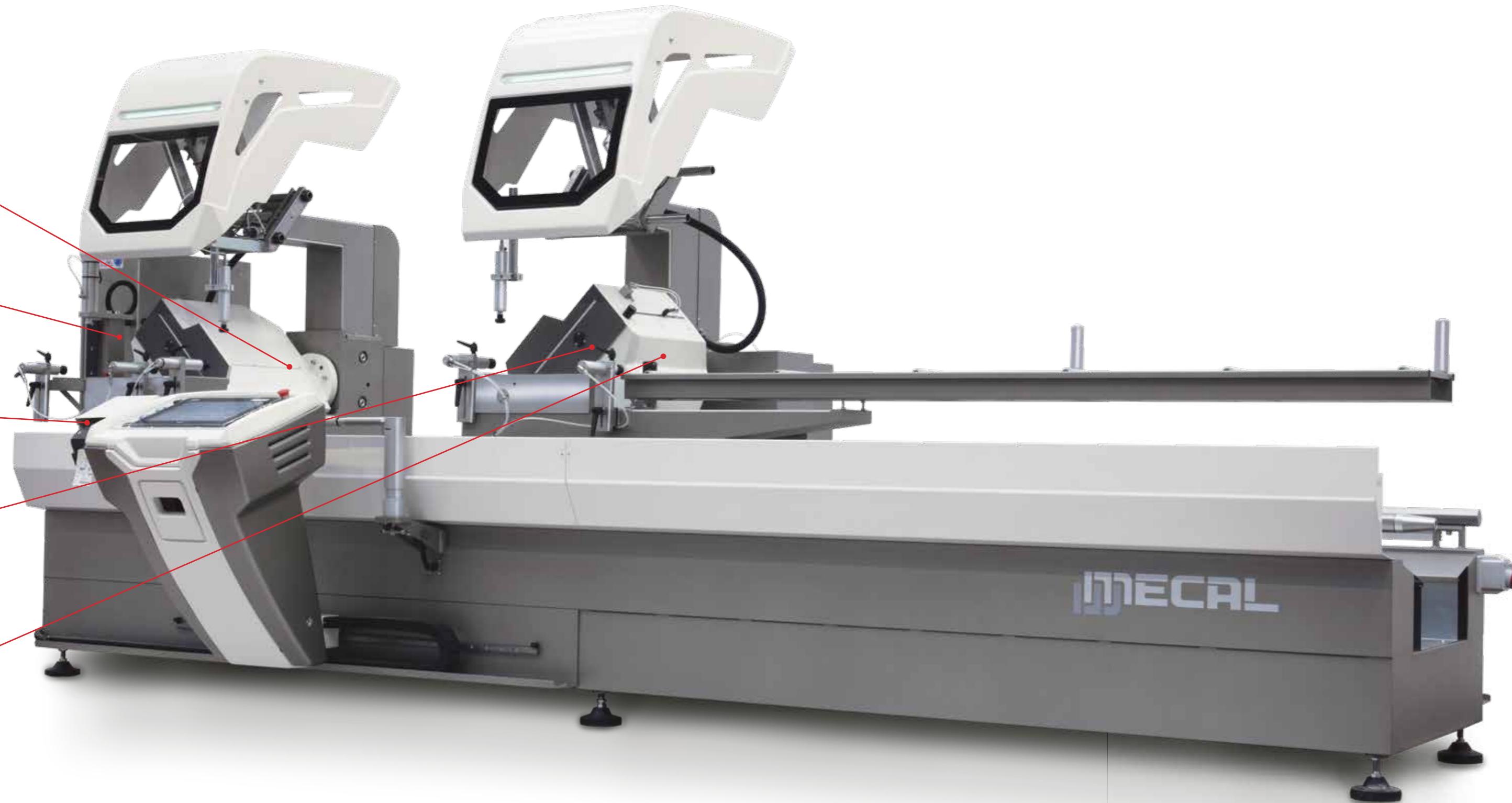
SW 553 Hoja/Disco Ø 550 mm